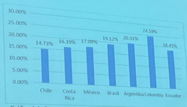
Gráfico 1.1: Comparación de nivel de instrucción de pregrado con países latinoamericanos