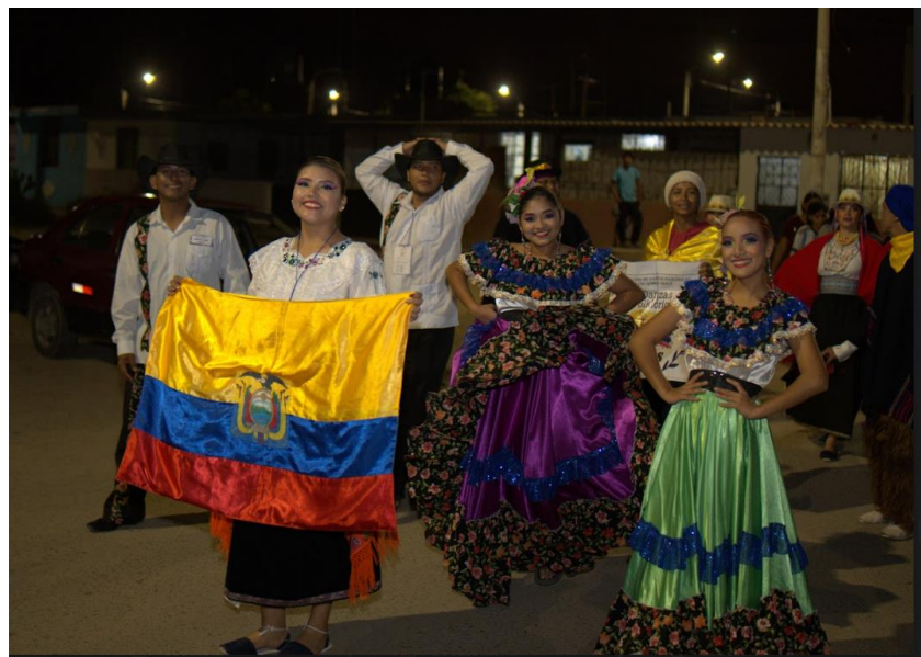
Participación de pregón en la Plaza de Armas Chiclayo