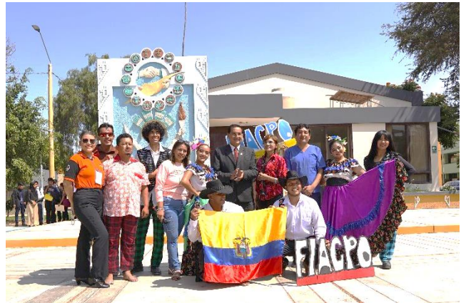
Participación de talleres, pregón y presentaciones en Calupe