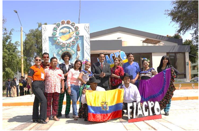
Participación de talleres, pregón y presentaciones en Calupe