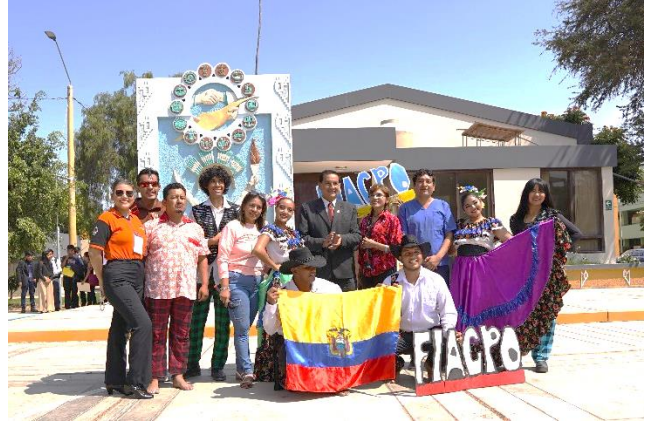
Participación de talleres, pregón y presentaciones en Calupe