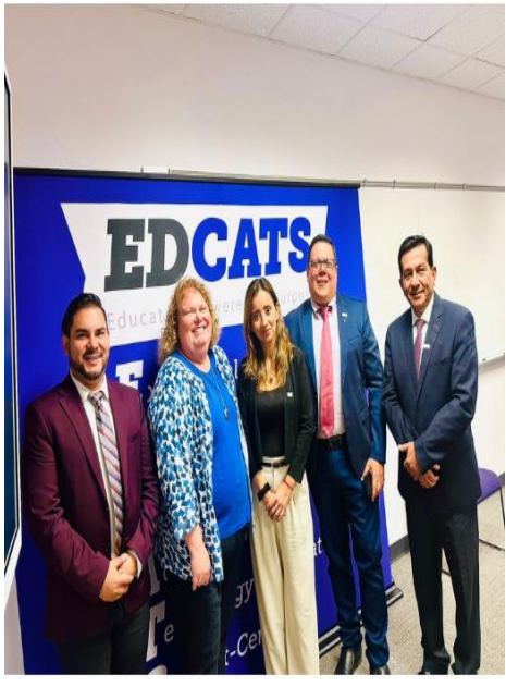
Con la Directora de la Facultad de Educación