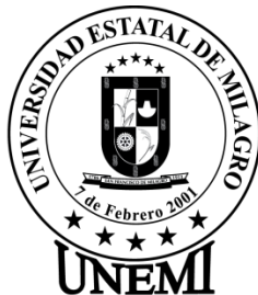
UNEMI SECRETARIA GENERAL