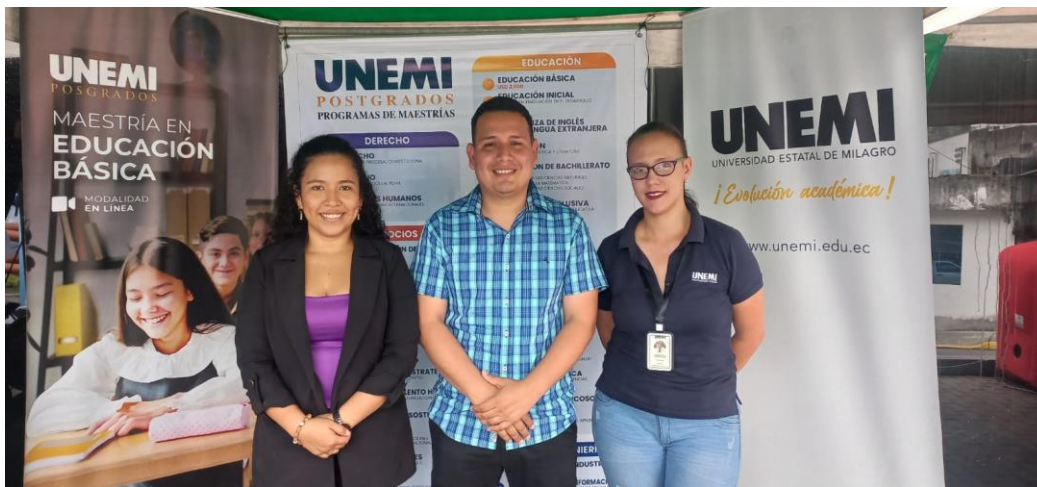
Inicio de actividades en el evento MIYA KA NA KI