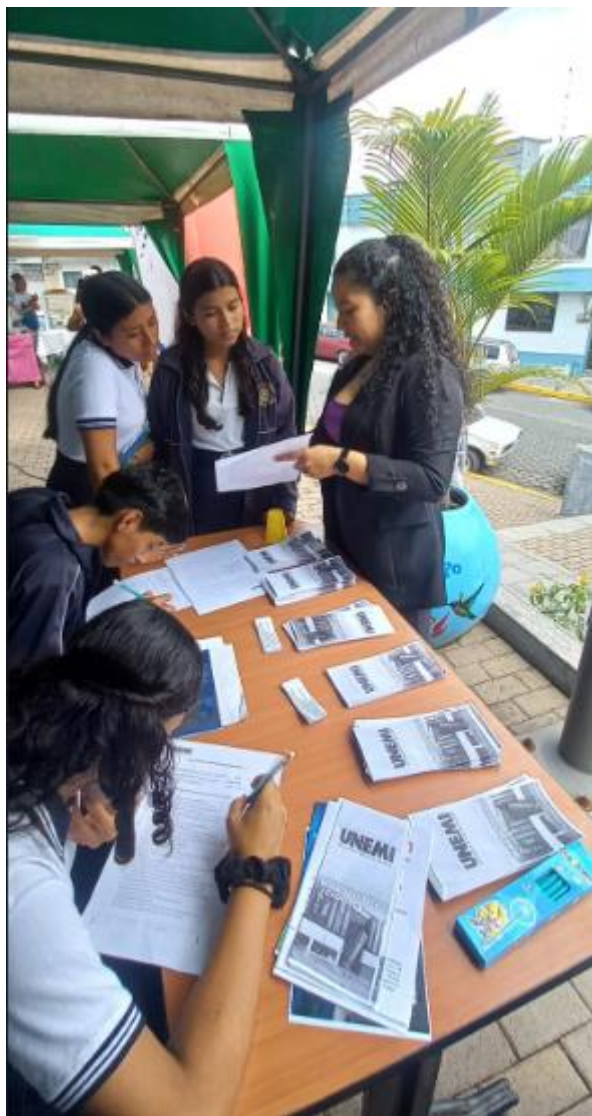
Socialización de las carreras que oferta Unemi a los estudiantes