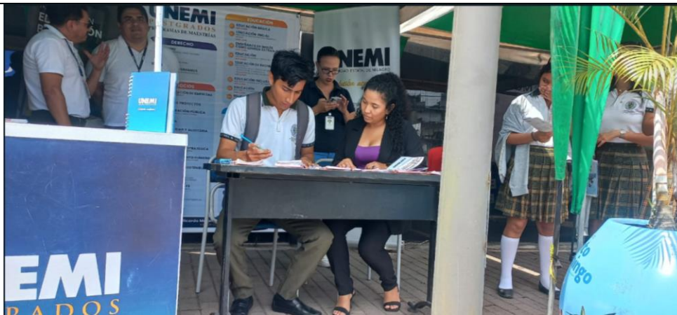
Evaluaciones de OVP a estudiantes en la ciudad de Santo Domingo